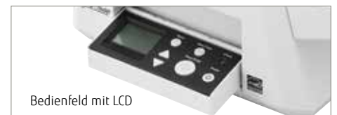
Bedienfeld mit LCD

Der fi-7600 verfügt auf beiden Seiten über ein Bedienfeld. Somit kann der Scanner für rechts- und linkshändigen Einsatz aufgestellt werden. Das im Bedienfeld integrierte LCD zeigt auf einen Blick den Gerätestatus an und ermöglicht die Auslösung von Erfassungsroutinen auf Knopfdruck.